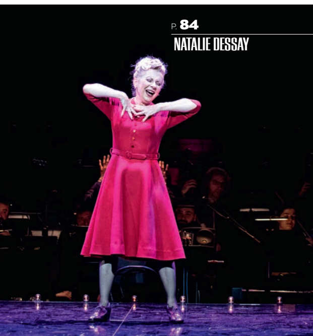
P. 84 NATALIE DESSAY